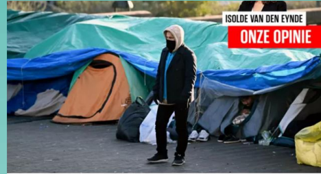
Vluchtelingen slapen in tentjes.

POLITIEK Het leefloon schrappen, verplichte inschrijven bij de VDAB, meer lessen Nederlands. In het Vlaams Parlement lanceert N-VA voorstellen om meer Oekraïense vluchtelingen aan de slag te krijgen. Net nu de Vlaamse regering zelf op een plan broedt om de VDAB en de lokale besturen meer armsgeld te geven om deze nieuwkomers te activeren.