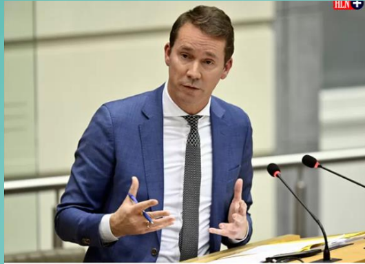
Volgens het kabinet van Vlaams minister van Werk Jo Brouns (CD&V, foto) heeft één op de drie ingeschreven Oekraïners in Vlaanderen intussen een job.