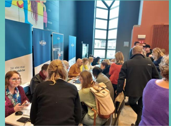
Zo'n 140 Oekraïense werkzoekenden kwamen naar de jobbeurs.

Vlaamse regering verplicht Oekraïense vluchtelingen om zich in te schrijven bij VDAB