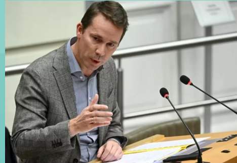
Vlaams minister van Werk Jo Brouns (CD&V)

ONZE OPINIE. “80% van de Oekraïense vluchtelingen werkt in Nederland. Niet in België. Een uitdaging, maar vooral een kans”